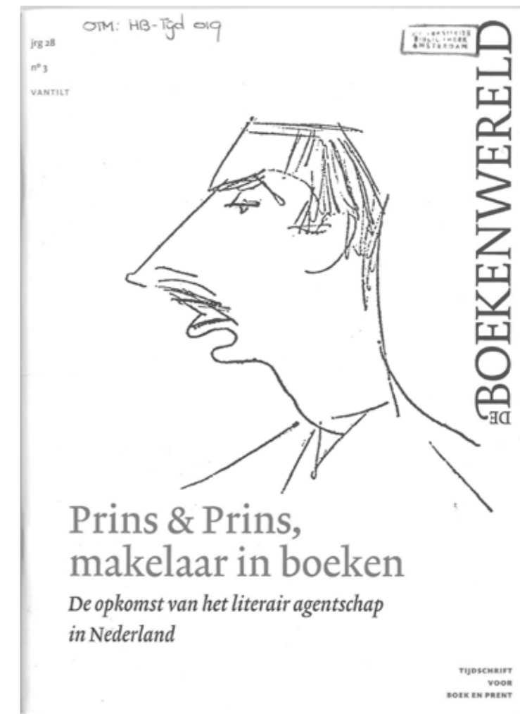
Omslag van het themanummer van De Boekenwereld over het literair agentschap Prins en Prins, gebaseerd op het archief van Prins en Prins

De stichting telde in 2011 51 'vakvrienden', die met een jaarlijkse donatie het werk van de stichting steunen.