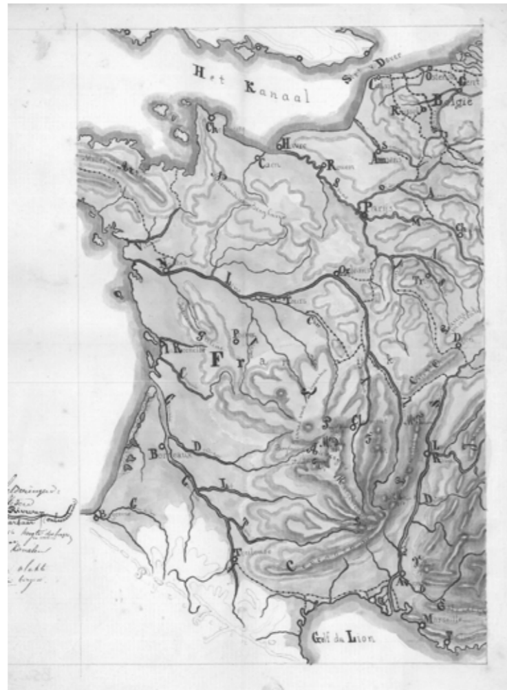
Kaart van de rivieren van Frankrijk. Uit het archief Suringar

Ook delen uit het omvangrijke archief van de KVB (oftewel de Vereeniging ter bevordering van de belangen des Boekhandels) worden opgenomen in het conserveringsprogramma. Het gaat hierbij vooral om verslagen en notulen uit de periode tot 1940. Samen met de gedigitaliseerde oude jaargangen van Boekblad tot 1940 ('Nieuwsblad van de Boekhandel') komt hiermee een groot stuk van de Nederlandse boekgeschiedenis in de negentiende en eerste helft twintigste eeuw voor digitaal onderzoek beschikbaar.